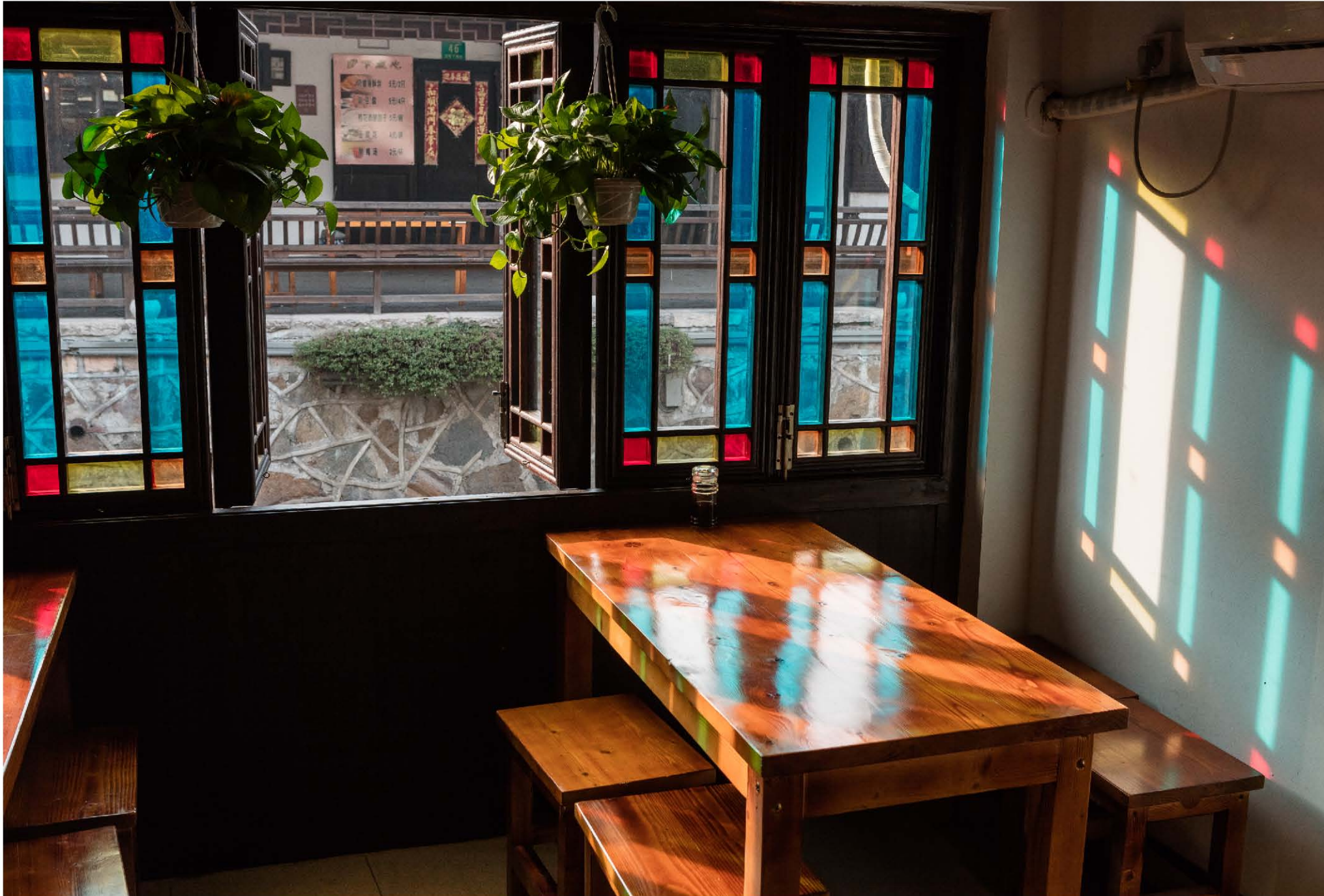
左圖：攝於南匯新場古鎮 Canon 5Ds相機。 f/8 1/250 ISO:100 光圈優先。