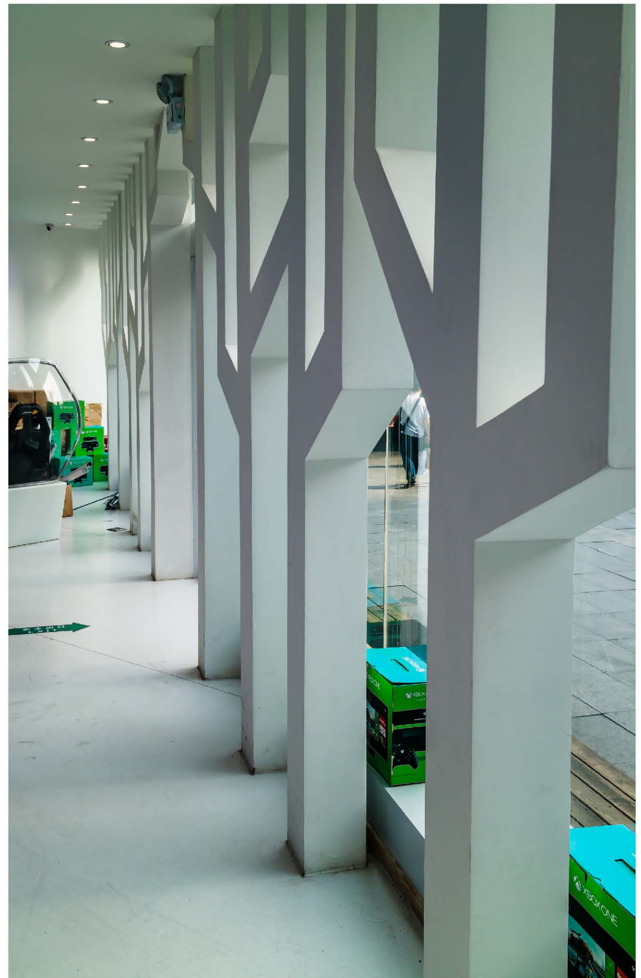
右上圖：攝于五角場下沉廣場。Canon M3相機。 f/5.6 1/250 ISO:100 光圈優先。