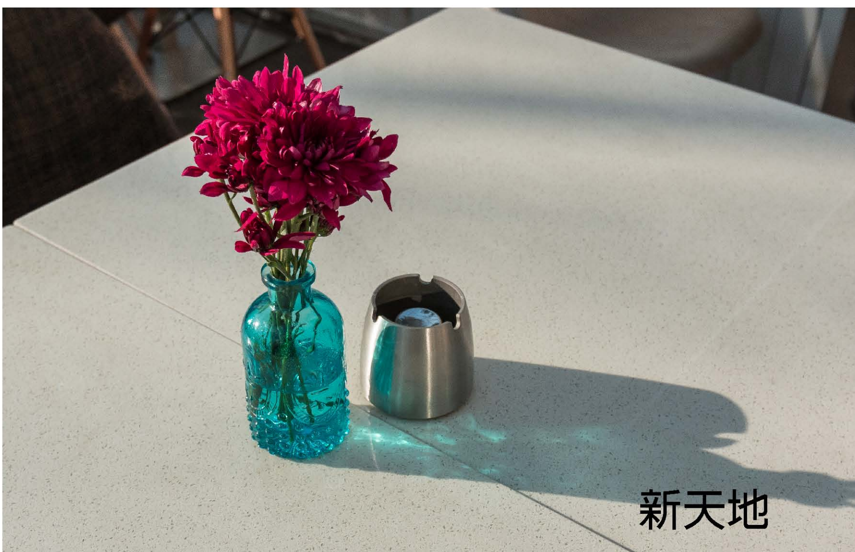
下圖：攝于新天地。 Canon 70D 相機。 f/4 1/1250 -0.7EV ISO:100 光圈優先。