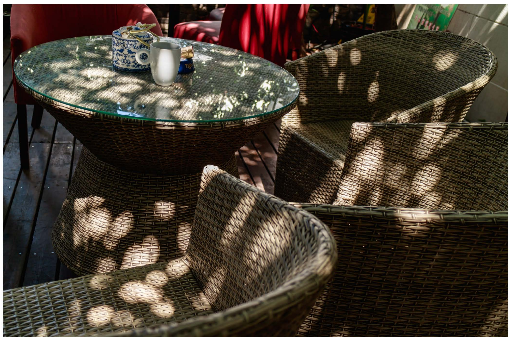
右下圖：攝于虹口區多倫路。Canon M3相機。 f/4 1/60 光圈優先。