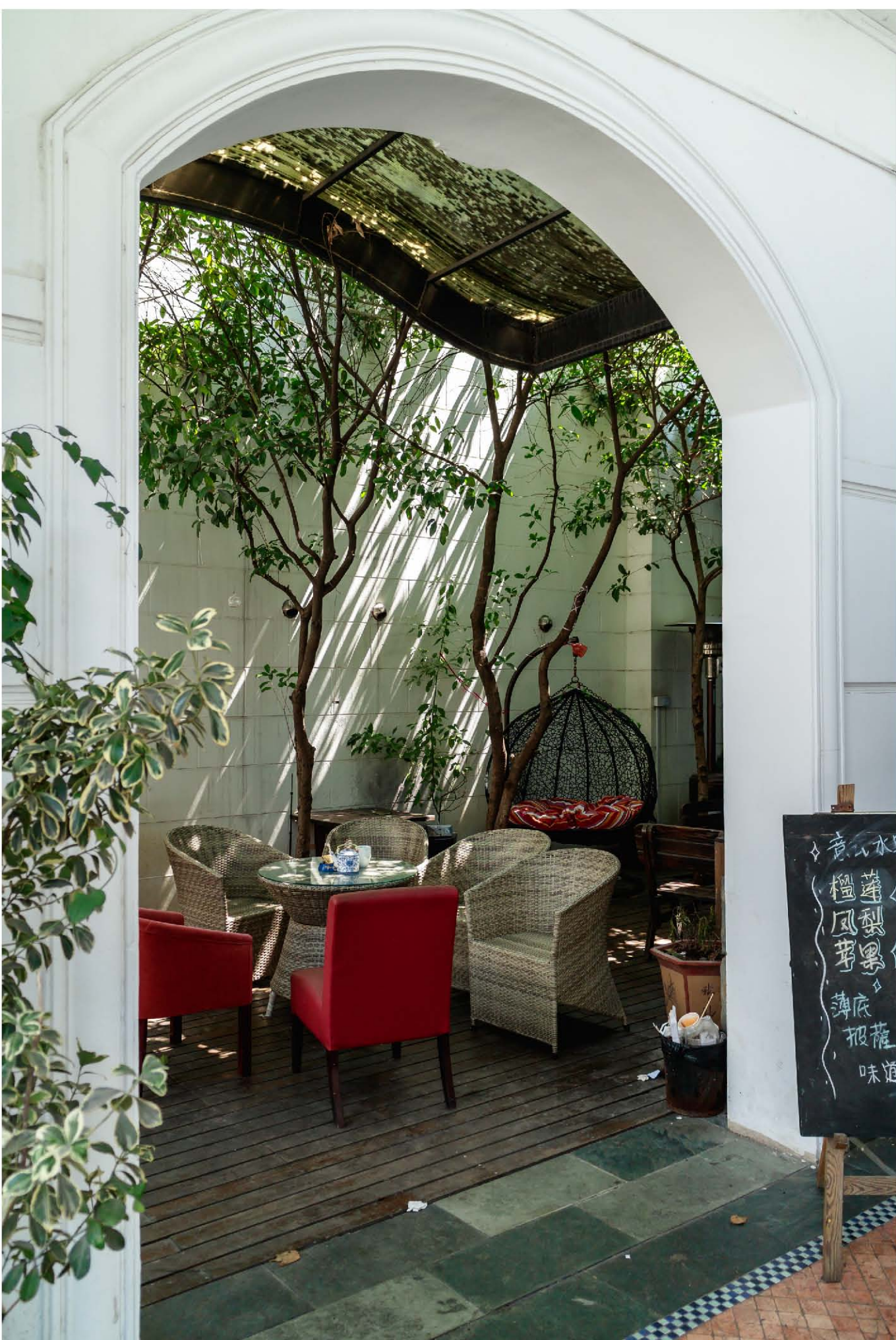
左圖：攝于多倫路。Canon M3 相機。 f/4 1/60 光圈優先。