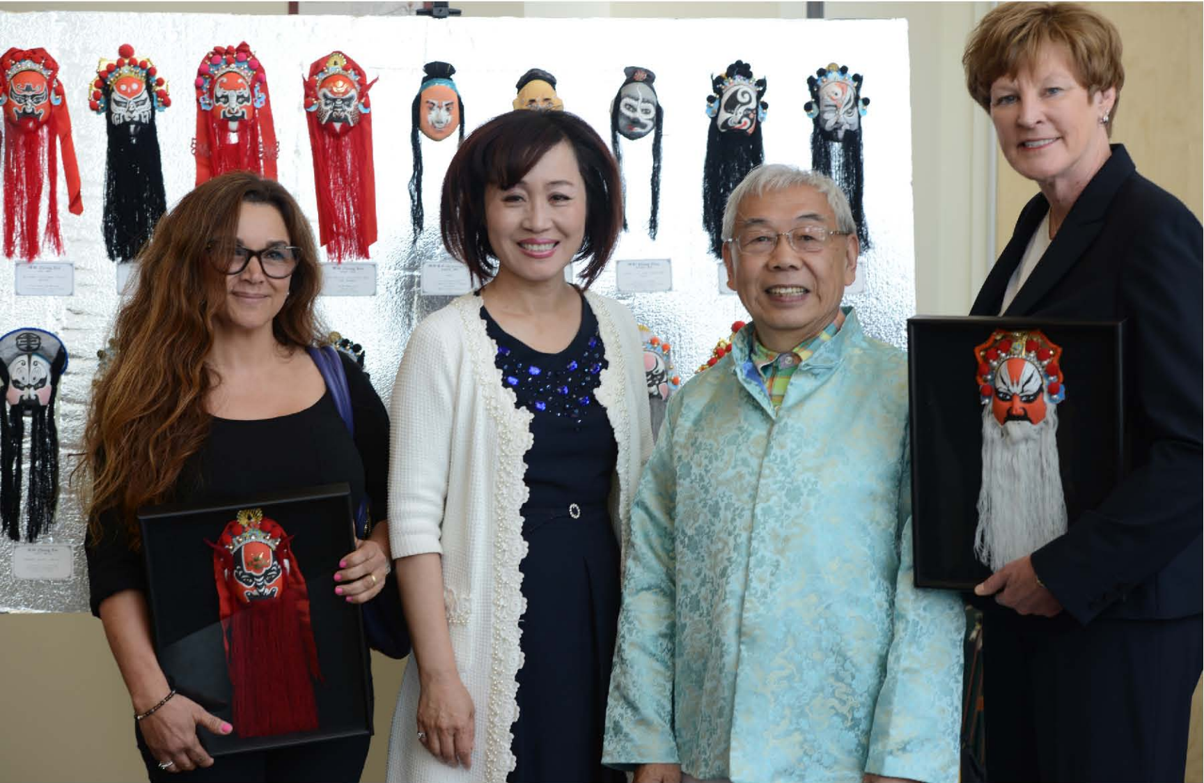
上圖：中國戲曲藝術