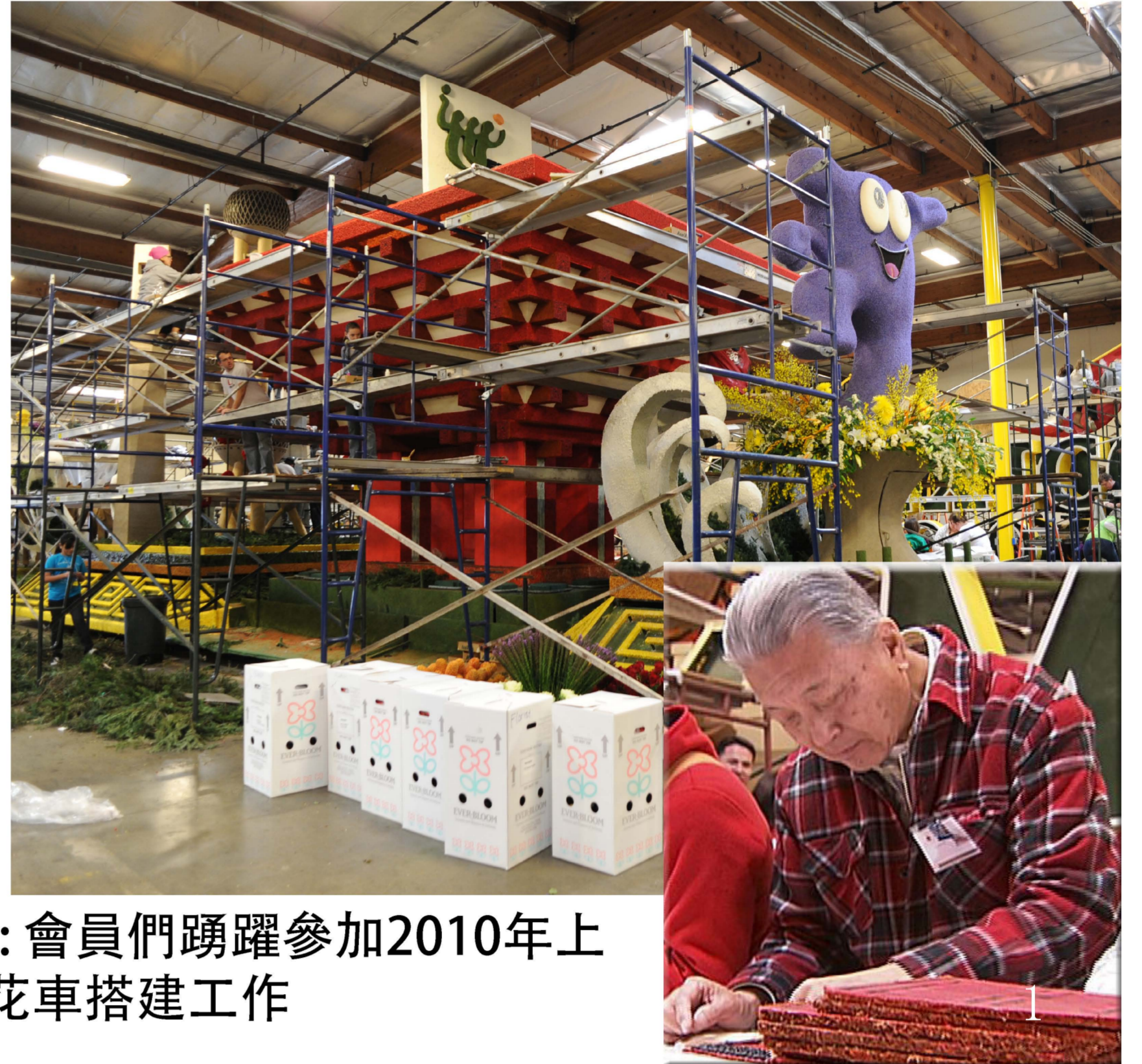
1、2圖：會員們踴躍參加2010年上海世博花車搭建工作