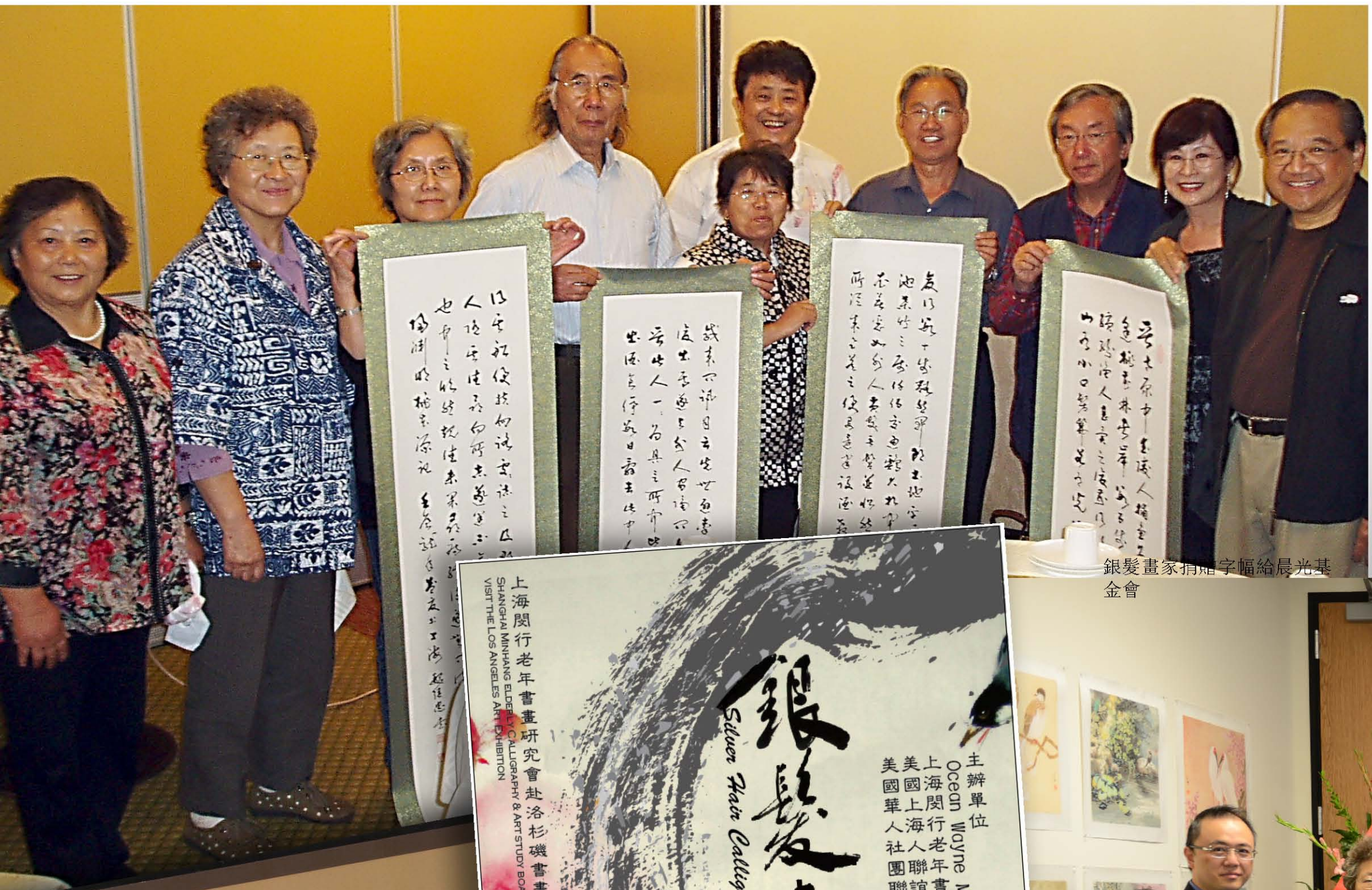
銀髮畫家捐贈字幅給晨光基金會