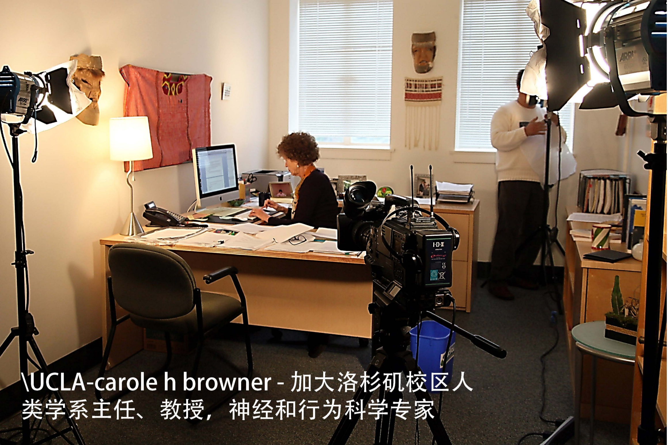
UCLA-carole h browner - 加大洛杉矶校区人类学系主任、教授，神经和行为科学专家