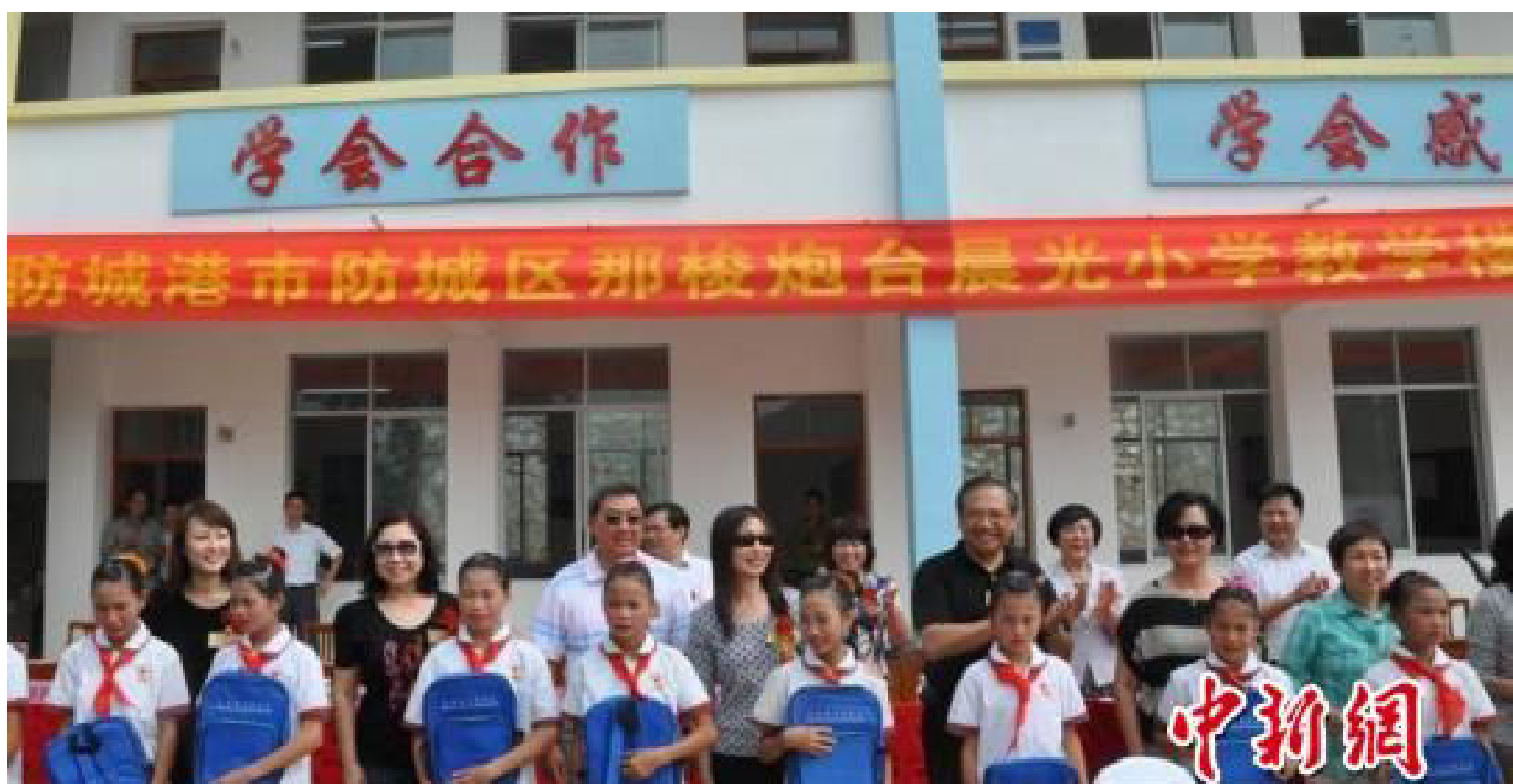
上圖：美国晨光基金会捐建校舍在广西防城港落成 下圖：美国晨光基金会代表团湖南慈善助学